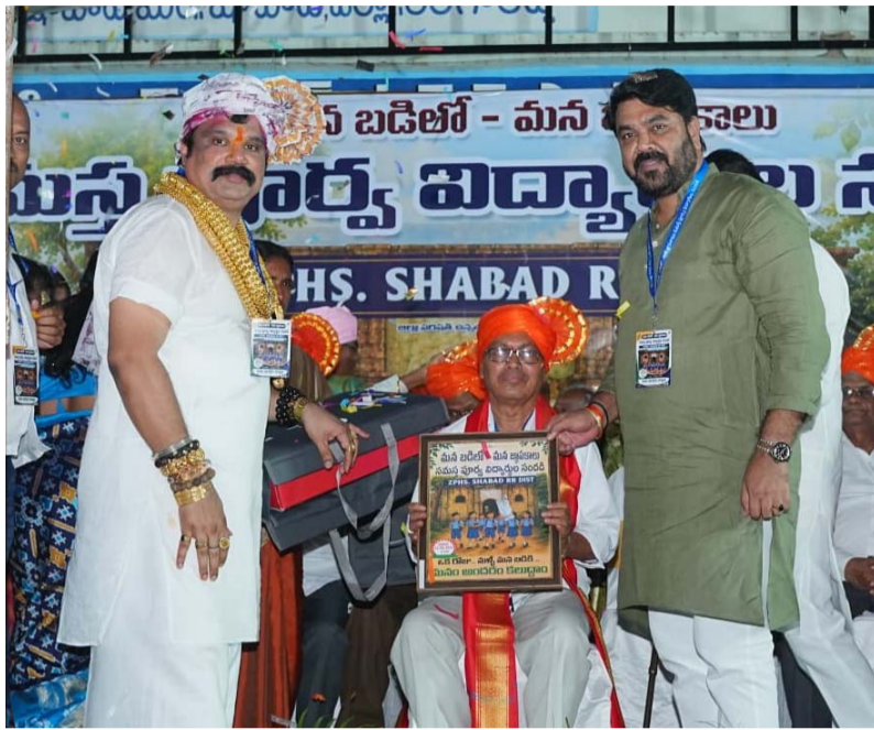
షాబాద్లో 3 వేల మందికి పైగా పూర్వ విద్యార్థుల మహా సమ్మేళనం

తెలుగుజ్యోతి, షాబాద్ జూన్ 14: షాబాద్ మండల కేంద్రంలోని జిల్లా పరిషత్ బాలుర ఉన్నత పాఠశాల చరిత్రలో స్వరాక్షరాలతో లిఖించదగిన అరుదైన ఘట్టం శనివారం ఆవిష్కృతమైంది. “మన బడి -- మన జ్ఞాపకాలు” పేరుతో నిర్వహించిన సమస్త పూర్వ విద్యార్థుల మహా సమ్మేళనం అక్షరాలా వేలాది హృదయాలను ఒకే తాటిపైకి తీసుకొచ్చింది. ఐదు దశాబ్దాలూ ఈ పాఠశాలలో విద్యనభ్యసించిన 50 బ్యాచ్లకు చెందిన 3 వేల మందికి పైగా పూర్వ విద్యార్థులు ఒకే వేదికపై కలుసుకోవడం కేవలం ఒక కార్యక్రమం కాదు... అది భావోద్వేగాల మహాసంగమం. చిన్ననాటి అడుగులు వడిన నేలపై మళ్లీ నడవడం, ఒకప్పుడు కూర్చున్న బెంచీలను తాకడం, చదివిన తరగతి గదులను చూడడం, ఆడిన మైదానంలో నిలబడడం ప్రతి ఒక్కరిలోనూ అపారమైన ఆనందాన్ని నింపింది. జీవిత పోరాటంలో ఎక్కడికెళ్లినా, ఎంత ఎత్తుకు ఎదిగినా, తమ జీవితాలకు పునాది వేసిన బడిని ఎవరూ మరచిపోలేరనే విషయాన్ని ఈ మహా సమ్మేళనం మరోసారి చాటి చెప్పింది. ఎన్నో ఏళ్ల తర్వాత కలుసుకున్న సహపాఠులు ఒకరినొకరు చూసుకుని భావోద్వేగానికి లోనయ్యారు. ఒకప్పుడు కలిసి చదివిన మిత్రులు నేడు తెల్లజుట్టుతో కనిపించగా, వారి కళ్లలో మాత్రం అదే బాల్య స్నేహం మెరిసింది. కొందరు తమ స్నేహితులను గుర్తు పట్టడానికి క్షణాలు పట్టగా, గుర్తుపట్టిన వెంటనే కాగిలించుకుని ఆనందభాష్యలు పెట్టారు. పాత జ్ఞాపకాలు, తరగతి గదుల్లో జరిగిన అల్లరులు, గురువుల మందలింపులు, అటపాటలు, పాఠశాల ఉత్సవాలు అన్నీ మళ్లీ కళ్లముందు కదలాడాయి. ఈ మహా సమ్మేళనానికి ప్రధాన స్ఫూర్తి 1992-93 బ్యాచ్కు చెందిన రాష్ట్ర హాకీ చైర్మన్ కొండ విజయకుమార్. పాఠశాలపై ఉన్న అపారమైన ప్రేమ, గురువుల పట్ల గౌరవం, సహచరుల పట్ల అనుబంధం ఆయనను ఈ మహాత్మర ఆలోచన వైపు నడిపించాయి.