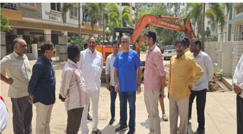
డ్రైనేజీ సమస్యకు శాశ్వత పరిష్కారం చోపి వర్షాకాల ముంపు నివారణకు చర్యలు

తెలుగుజ్యోతి మాదాపూర్ : 14 జూన్ : మాదాపూర్ డివిజన్ పరిధిలోని జూబ్లీ గార్డెన్ కాలనీలో నెలకొన్న జెట్ లెట్ సమస్య పరిష్కారానికి తీసుకోవాల్సిన చర్యలను పి ఏ సి చైర్మన్ ఆరెకపూడి గాంధీ పరిశీలించారు. కాలనీలో డ్రైనేజీ సరిగా లేకపోవడం, జెట్ లెట్ కుంచించుకోవడం వల్ల మురుగు సమస్య తీవ్రంగా మారినది ఆయన గుర్తించారు. ఈ సందర్భంగా గాంధీ మాట్లాడుతూ జెట్ లెట్ సమస్యకు త్వరలోనే శాశ్వత పరిష్కారం చూపిస్తామని తెలిపారు. డ్రైనేజీ వ్యవస్థను సరిచేసి కాలనీ వాసులకు ఎటువంటి ఇబ్బందులు లేకుండా చూడాలని అధికారులకు ఆదేశించారు. వర్షాకాలంలో కాలనీ ముంపుకు గురి కాకుండా వరదనీరు సాపీగా మారేలా చర్యలు తీసుకోవాలని సూచించారు. సరింతగా డ్రైనేజీ మ్యాన్ హోల్స్ ను మరమ్మత్తు చేసి, ఎయిర్ టెక్ మిషన్ ద్వారా చెత్త పూడికలను తొలగించి నీటి ప్రవాహం నిరంతరంగా సాగేలా చూడాలని అధికారులకు తెలిపారు. అవసరమన్న చోట మ్యాన్ హోల్స్ ను పునరుద్ధరించి