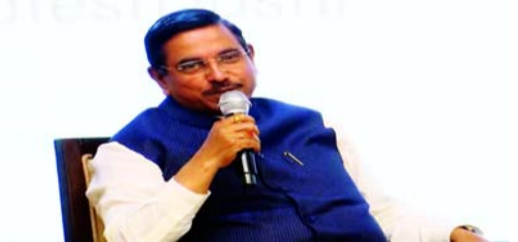
కూడా పెరిగాయి. కాబట్టి సామాన్యుల గురించి మాకూ ఆందోళన ఉంది. కానీ అదే సమయంలో గ్యాస్ ధరల పెంపు అనివార్యంగా మారింది. "

"గ్యాస్ సిలిండర్ ధరల పెంపు పట్ల మేము కూడా చాలా బాధపడుతున్నాం, విచారం వ్యక్తం చేస్తున్నాం. కానీ మమ్మల్ని విమర్శించే ముందు ప్రతి ఒక్కరూ ప్రపంచవ్యాప్త పరిస్థితులను అర్థం చేసుకోవాలి. ప్రపంచం తీవ్రమైన సంక్షోభాల మధ్య సతమతమవుతోంది. రవాణా సజావుగా సాగకపోవడం, చాలా పరిశోధన వనరుల నుంచే ఎల్పీజీ లభించడం వంటి సమస్యలు ఉన్నాయి. ఎల్పీజీ, పెట్రోల్, డీజిల్ ల వినియోగదారులకు ఎటువంటి ఇబ్బంది కలగకుండా మనీండుకు ప్రధాని సరేంద్ర మోదీ నేతృత్వంలోని భారత ప్రభుత్వం సేకరణ వనరులను పెంచడానికి ప్రయత్నిస్తోంది. భారత్ కు చాలా దూరంలో ఉన్న దేశాల నుంచి కూడా గ్యాస్, ఇంధన సేకరణ జరుగుతోంది. రవాణా ఖర్చులు ఎక్కువగా ఉన్నాయి. మూల ధర కూడా అధికంగా ఉంది. అలాగే 40-45 రోజుల రవాణా సమయం కారణంగా బీమా ఖర్చులు