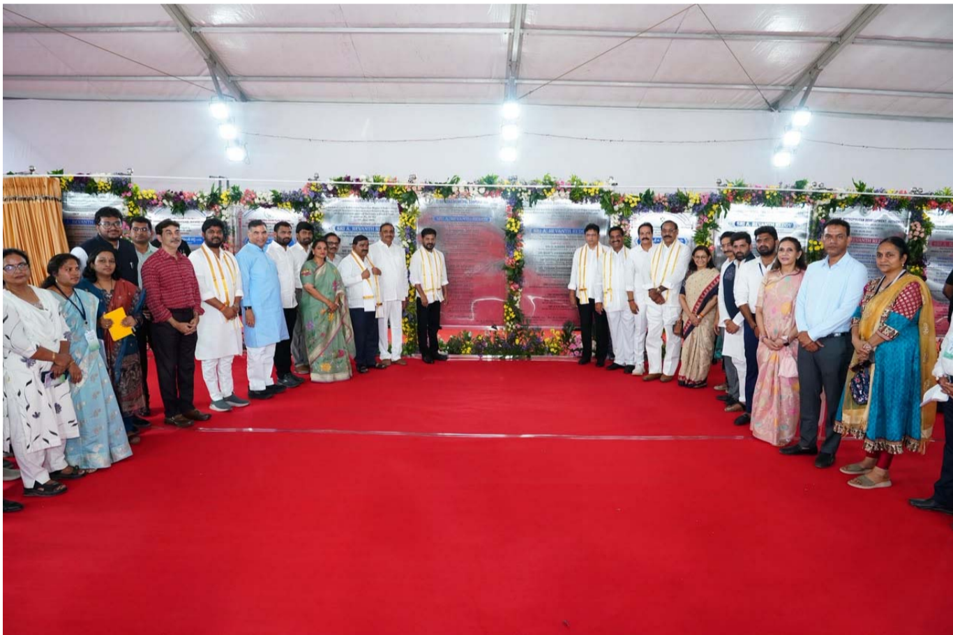
తెలుగుజ్యోతి మియాపూర్ :08 జూన్