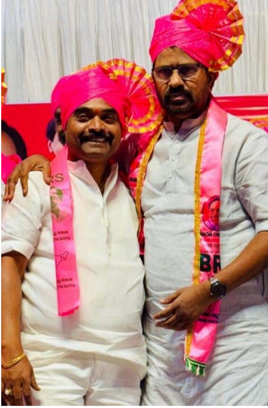
తెలుగుజ్యోతి నాగరం,జూన్ 7: