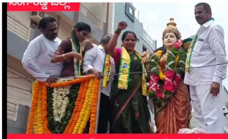
మాట తప్పితే తెల్లపూర్ శిలాశాసనం వద్ద కట్టెసి రాళ్లతో కొట్టండి

కవితకు, కళాకారులకు మేధావులకు తీవ్ర అన్యాయం జరిగిందన్నారు. భవిష్యత్తులో తెలంగాణ రాష్ట్ర సేన పార్టీ అధికారంలోకి వస్తుంది వచ్చాక తెలంగాణ అమరవీరుల కుటుంబాలకు, తెలంగాణ ఉద్యమకారులకు న్యాయం చేస్తామన్నారు. సంగారెడ్డి జిల్లాలో కాంగ్రెస్ బిజెపి, బి ఆర్ ఎస్, పార్టీల నాయకులు కుమ్ముక్క రాజకీయాలు చేస్తున్నారన్నారు. వారి అనుచరులకు, బంధువులకు, వారి సామాజిక వర్గాల వారికి, పెద్దపేట వేస్తున్నారు అని తెలియజేశారు. పనులు, పదవులు ఇస్తున్నారు అన్నా నాయకులు నాయకులు చేస్తున్నారన్నారు, ఒక సామాజిక వర్గానికి పెద్ద పీట వేస్తున్నారు అన్నారు. పార్టీల కోసం పనిచేసే సీనియర్ నాయకులను కార్యకర్తలు పక్కన పెడుతున్నారన్నారు. సామాజిక సమతుల్యత పాటించడం లేదు. నేను అన్ని సామాజిక వర్గాల సమన్వయం చేస్తాను అన్నారు. సంగారెడ్డి నియోజకవర్గ నాయకులు కార్యకర్తలు డప్పు జప్పులతో భారీ బైక్ ర్యాలీ నిర్వహించి స్వాగతం పలికారు. ఈ కార్యక్రమంలో బాలయ్య మాజీ జిల్లా